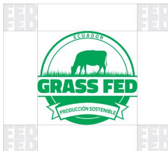
Figura 2.- Margen de seguridad óptimo

Para todos los soportes y formatos, se ha determinado un área de seguridad mínima (Figura 3); o evitando que se sobrepongan a textos y elementos gráficos que en su momento complementen el diseño, aplicación o adaptación.