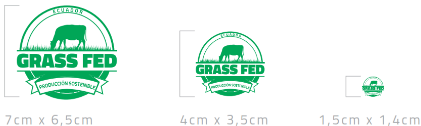
Figura 4.- Reducción del logotipo

El tamaño del logotipo para el uso en etiquetado será reproducido de 7 cm de alto y 6,5 cm de ancho; sin embargo, se podrá utilizar un logotipo 4 cm de alto y 3.5 de ancho hasta un mínimo de 1,5 cm de alto y 1,4 de cm de ancho, en aplicaciones que lo consideren estrictamente necesario.