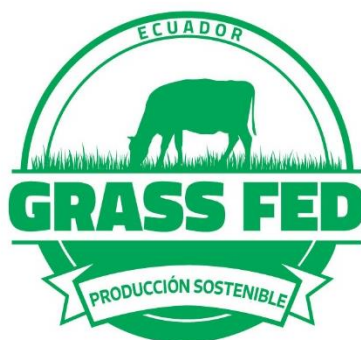
Figura 1.- Logotipo distintivo de la marca de certificación Grass Fed Ecuador Producción Sostenible

En cuanto al diseño, el logotipo es el que se encuentra presentando en la Figura 1. El logotipo distintivo de la marca de certificación Grass Fed Ecuador Producción Sostenible, deberá estar ubicado en un sitio fácilmente visible, legible, indeleble y respetando los márgenes del mismo.