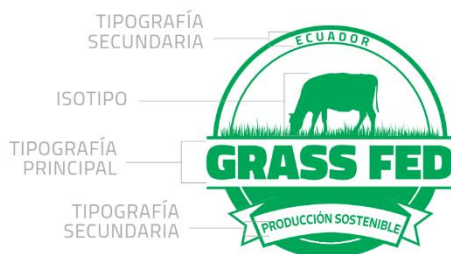
Figura 6.- Elementos de la marca del logotipo

La familia tipográfica (letra) del logotipo distintivo de la marca de certificación Grass Fed Ecuador Producción Sostenible es: