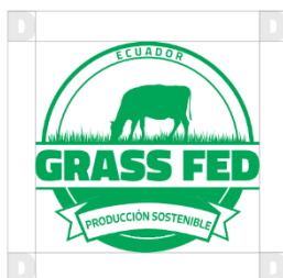
Figura 3.- Margen de seguridad mínima